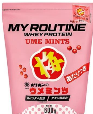
マイルーティーン オリオン ウメミンツ風味プロテイン