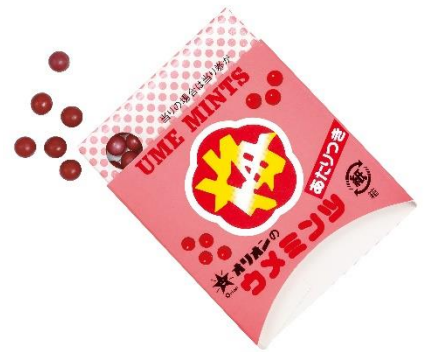
オリオンの「あたり梅ミンツ」

プロテインはバニラやチョコレートなど比較的甘いフレーバーが多いですが、この商品はその名の通り、ウメミンツ風味。梅パウダーとクエン酸を配合し、酸っぱさの中にもウメミンツの甘さが感じられる味となっています。普段とはちょっと違うフレーバーを飲んでみたい方に特におすすめです。あたりくじ付の「マイルーティーン オリオン ウメミンツ風味プロテイン」ですが、はずれでもご安心ください。数々のヒット商品を生み出した同社の企画本部長で、“浪花の駄菓子王”の異名を取る、高岡五郎氏による遊び心いっぱいのマーケティング語録などがプリントされています。 はずれくじにも遊び心が詰め込まれた商品です。あたりくじをお客様ご自身で指定送付先に送っていただければ、もう1個、マイルーティーン オリオン ウメミンツ風味プロテインをプレゼント します。