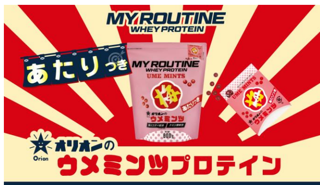
WEBサイトのファーストビュー

プロテインブランド「マイルーティーン」と、オリオン株式会社が昭和54年に発売した、「梅ミンツ」の当たり付きバージョン「当たり梅ミンツ」とのコラボレーションプロテイン。40年以上愛された程よい甘酸っぱさをプロテインで再現し、さらに あたりくじ付き も再現。