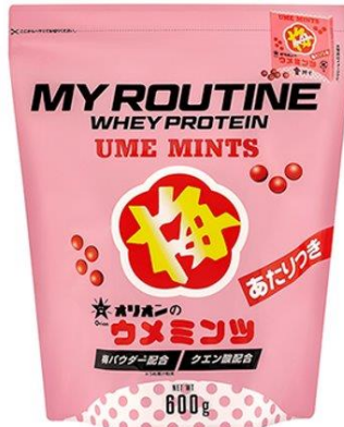
マイルーティーン オリオン ウメミンツ風味プロテイン