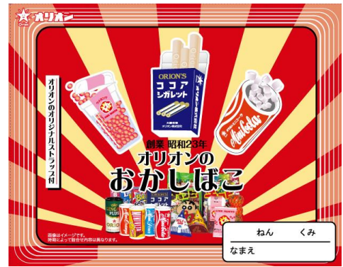
オリオンが販売している まるで道具箱のような「おかしぼこ」

オリオンは、“子供が大人のマネ”をする事柄から着想を得て、商品化をしているため、おのずと大手商品をパロディした形になりがちだという。そのためか、「国内外の大きい企業さんから沢山訴えられたし、めちゃくちゃ怒られましたわ。」とのこと。「でも全部僕の中では、パクリじゃなくて敬意と愛情を持ったオマージュや！パロディや！と思ってます。これからも挑戦を続けます。」