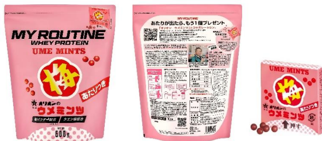
マイルーティーン オリオン ウメミンツ風味 プロテイン

プロテインブランド「マイルーティーン」と、オリオン株式会社が昭和54年に発売した、「梅ミンツ」の当たり付きバージョン「当たり梅ミンツ」とのコラボレーションプロテイン。40年以上愛された程よい甘酸っぱさをプロテインで再現し、さらに あたりくじ付き も再現。