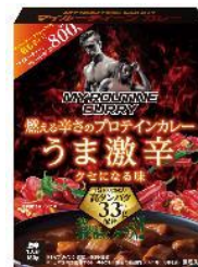
マイルーティーン カレー うま激辛