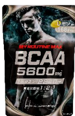
マイルーティーン MAX BCAA5600