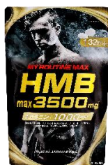
マイルーティーン MAX HMBmax3500