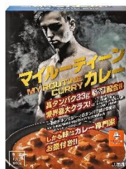
マイルーティーン カレー 中辛