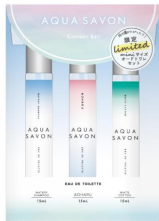
▲パッケージデザインイメージ