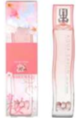
※1 2023年11月末時点の自社出荷実績