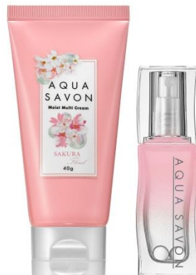
シャボンの清々しさとサクラの可憐な 春の訪れとともに恋しくなる香り