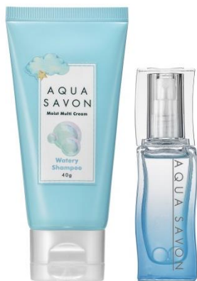
シャンプーの泡のよう みずみずしくて 清々しい気分になる香り