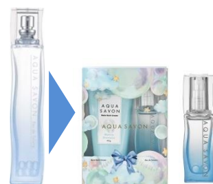
通常サイズ (80mL) ミニサイズ (17mL)

通常80mLサイズで販売しているオードトワレのミニサイズ アクア シャボン オードトワレの象徴ともいえるガラス玉も入っています。 (通常サイズ：12玉/ミニサイズ：2玉) ※単品での販売は予定しておりません