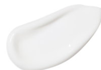
テクスチャー (イメージ)

オードトワレと同じ香りで全身に使える植物由来成分配合のボディクリーム 累計販売本数70,000本(※3)を突破している人気のクリーム、「ママ アクア シャボン」シリーズのモイストマルチクリームをベースに作られています。 さらっと軽いテクスチャーで肌馴染みが良い使用感が特長です。 ※単品での販売は予定しておりません