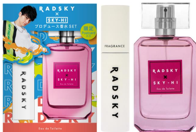
ラッドスカイ ネオン オードトワレ コフレセット20SS

株式会社ウエニ貿易（本社：東京都台東区 代表取締役社長：宮上光弘）は、10代後半～20代前半の男性に向けた香水ブランド「RADSKY（以下：ラッドスカイ）」の公式アンバサダーでアーティストのSKY-HIさんプロデュースの香水「ラッドスカイ ネオン オードトワレ」のミニボトル（携帯用アトマイザー）・ポストカードセットをロフト限定・数量限定で4/16(木)18:00より同ネットストア、4/17(金)より同店舗にて発売いたします。