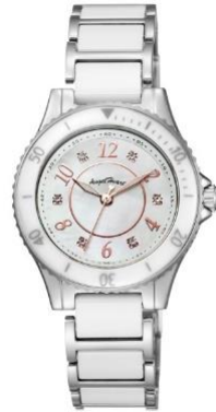
WLS29SS ¥ 22,000