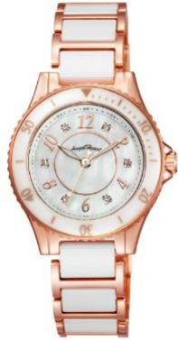
WLS29PG ¥ 23,000