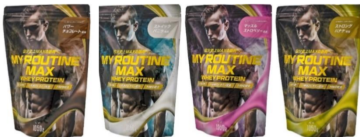
（左から）パワーチョコレート風味 / スティックバニラ風味 / マッスルストロベリー風味 / ストロングバナナ風味

【マイルーティーン ブランドサイト】 https://www.myroutine.jp