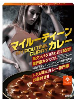
マイルーティーン カレー 甘口 180g