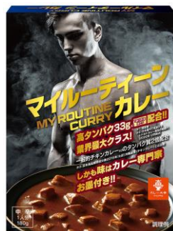
マイルーティーン カレー 中辛 180g