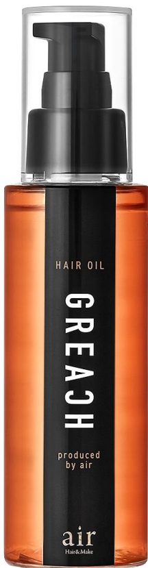
グリーチ ヘアオイルセラム 100mL

※3 保湿成分 ※4 保湿成分：（ジヒドロキシメチルシリルプロポキシ）ヒドロキシプロピル加水分解ダイズタンパク ※5 保湿成分：加水分解エンドウタンパク、加水分解ダイズタンパク、加水分解ローヤルゼリータンパク ※6 保湿成分：ヒマワリ種子油、オリーブ果実油、ホホバ種子油、アーモンド油、サフラワー油、ブドウ種子油、アルガニアスピノサ核油、アンス核油、マカデミア種子油、カニナバラ果実油