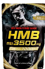
マイルーティーン MAX HMBmax3500