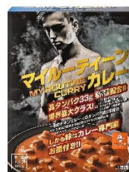
マイルーティーン カレー 中辛