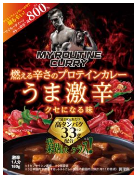
マイルーティーン カレー うま激辛 180g