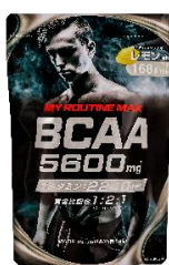
マイルーティーン MAX BCAA5600