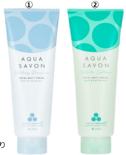
※7 累計出荷実績 2019年9月～2022年6月