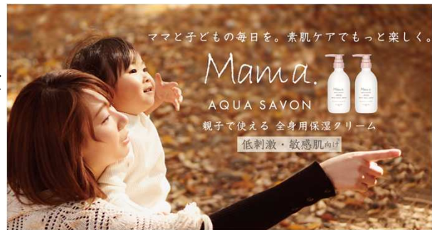
キービジュアル：親子の何気ない触れ合い、楽しい時間を表現

2015年3月に誕生し、多くのママに愛用いただいていた『ママ アクア シャボン』。今よりもっと“子どもとの毎日を楽しみたいママを応援できるブランド”になるべく、未就学児の子どもを持つママたちへ保湿ケア製品に関するインタビューを実施 (※3) 。意見や要望に基づいてブランド及び商品のリニューアルを進めました。素肌ケア=子どもとの毎日が楽しくなる要因を担うと位置づけ。「ママと子どもの毎日を。素肌ケアでもっと楽しく。」をブランドコンセプトとし、親子が一緒に使う素肌ケアのための「5つのこだわり」を掲げていきます。