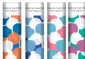
左から、シャンプーフローラルの香り、ウォータリーシャンプーの香り、大好きなせっけんの香り、ホワイトコットンの香り