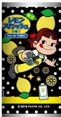
パターン② いい香りに なあれ☆