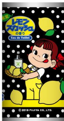
パターン③ フレグランス できたよ！