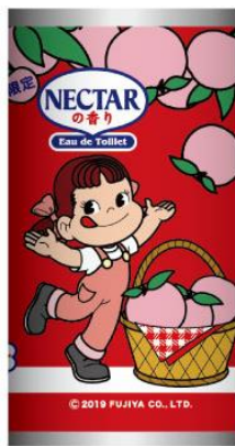
パターン① もぎたて フレッシュ！