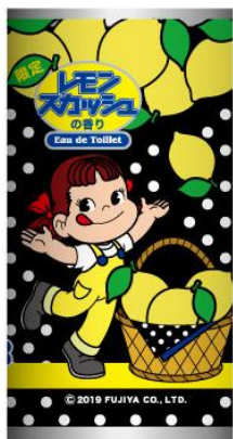
パターン① もぎたて フレッシュ！

パッケージの裏面には果実の収穫からフレグランスができあがるまでの工程をデザインしています。