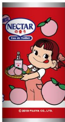
パターン③ フレグランス できたよ！