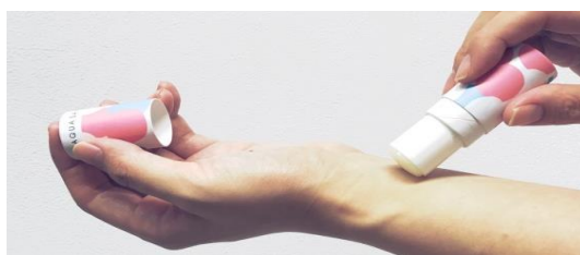
リップクリームのように練り出して使用するスティック型の練り香水