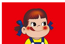
ペコちゃん キャンディコロン ソーダの香り