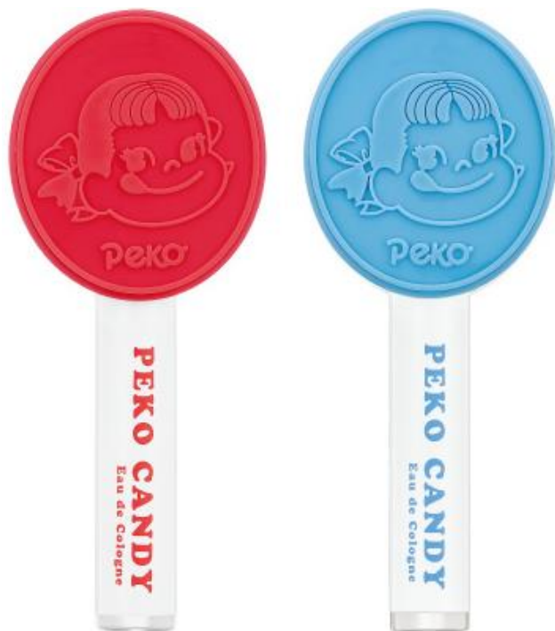
ペコちゃん キャンディコロン ストロベリーの香り