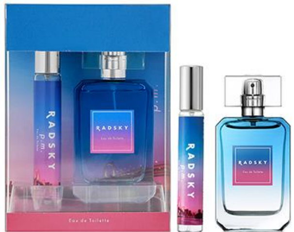
ラッドスカイ ピーエム オードトワレ コフレセット20SS