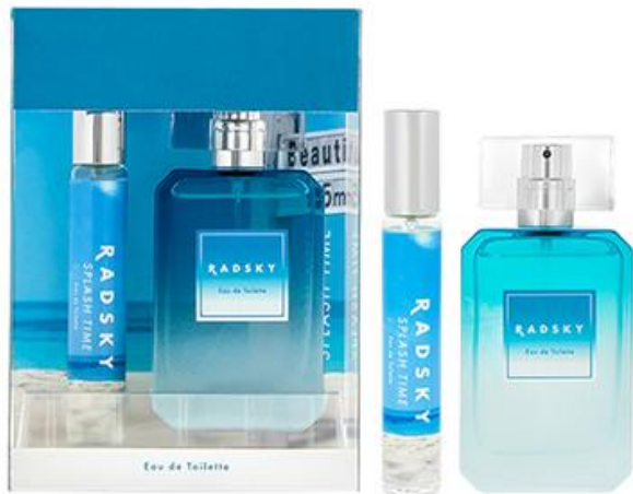
ラッドスカイ スプラッシュタイム オードトワレ コフレセット20SS