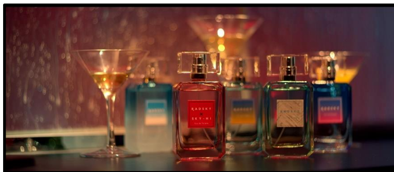
「Sexual Healing」ミュージックビデオでのRADSKY登場シーン

『ラッドスカイ』はSKY-HI（スカイ ハイ）さんがアンバサダーを務める、10代後半～20代前半の男性を応援する香水ブランドで、昨年10月にはSKY-HIさんプロデュースの香りも誕生。2020年9月23日に発売される初のベストアルバム『SKY-HI's THE BEST』の収録曲で、9/11(金)に先行配信となるSKY-HIさんのニューシングル『Sexual Healing』のミュージックビデオの中に、ラッドスカイシリーズの香水が、SKY-HIさんの傍で艶やかな世界観を盛り上げるアイテムとして登場しています。ミュージックビデオの赤い世界に染まったラッドスカイのボトルにも注目です。