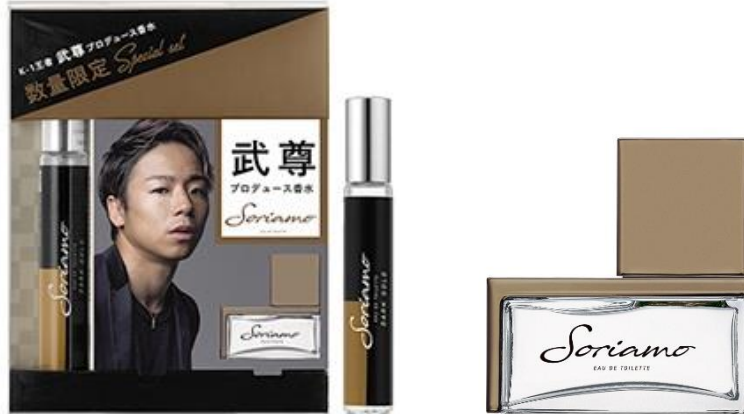
外箱 ミニトワレ 15mL オードトワレ 50mL