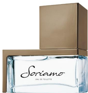
ソリアーモ ダークゴールド オードトワレ 50mL

株式会社ウエニ貿易（本社：東京都台東区 代表取締役社長：宮上光弘）は、K-1王者の武尊さんが公式プロデューサーの、10代後半～30代前半の男性・女性に向けた香水ブランド「Soriamo(以下：ソリアーモ)」の第3弾となる新しい香水をスペシャルセットで10/1(木) 18:00よりロフトネットストア、10/2(金)より全国のロフト各店（一部店舗を除く）にて先行販売を開始します。