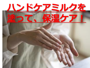
ハンドケアミルクを 塗って、保湿ケア！