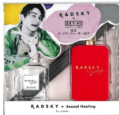
ラッドスカイ セクシャルヒーリング コフレセット 21S (数量限定)

深みのあるホワイトムスクが鮮やかでセクシーな印象を与える 誘い上手なホワイトムスクの香り