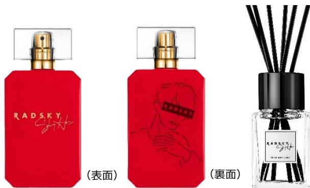
オードトワレとリードディフューザー ※本来のリードスティックの長さは19cmです