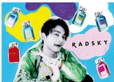
ラッドスカイ 21SSメインビジュアル