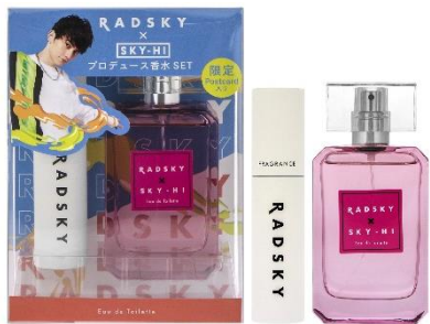
コフレセット ネオン オードトワレ 50mL / ミニサイズアトマイザー