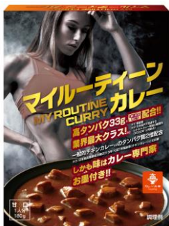
マイルーティーン カレー 甘口 180g