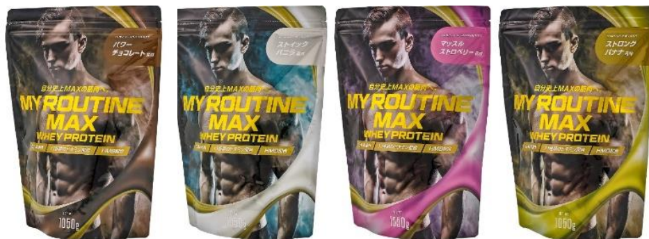
(左から) パワーチョコレート風味 / スティックバニラ風味 / マッスルストロベリー風味 / ストロングバナナ風味

「MY ROUTINE MAX (マイルーティーン マックス)」は、日本の製品では最大級の、1食あたりタンパク質量25g以上、 最大26.8g 摂取できる配合量を実現しています。(フレーバーにより異なります。)自分を極限まで追い込み、 なりたいカラダを共に目指し 自分を高めて、打ち勝つ*2 強さと身体づくりをサポートします。