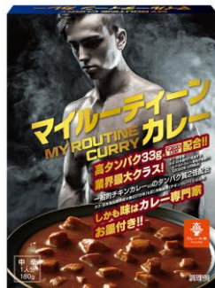
マイルーティーン カレー 中辛 180g