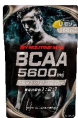
マイルーティーン MAX BCAA5600