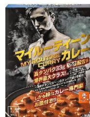
マイルーティーン カレー 中辛