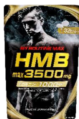
マイルーティーン MAX HMBmax3500