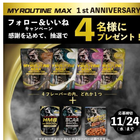
【Instagramキャンペーン投稿画像】

マイルーティーン MAX プロテイン(1050g)・マイルーティーン MAX maxHMB3500・マイルーティーン MAX BCAA5600・マイルーティーン カレー(中辛)のセットを、抽選で各4名様にプレゼントします。プロテインはパワーチョコレート風味、ストイックバナナ風味、マッスルストロベリー風味、ストロングバナナ風味の4フレーバーの内のいずれかになります。フレーバーをお選びいただくことはできません。