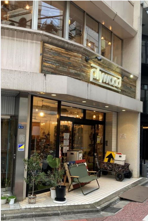
plywoodニホンバシ店 外観 ワイルドギア： https://bit.ly/339WcXk