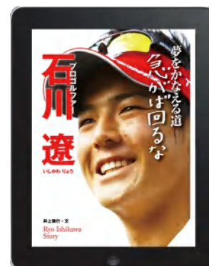
「プロゴルファー 石川遼 夢をかなえる道 急がば回るな」