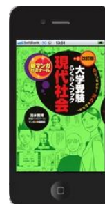
「大学受験らくらくブック」 シリーズ

「課長のためのビジネス演技力養成講座」 「人に好かれたら、仕事は9割うまくいく」 「お金持ちになる男、なれない男の習慣」 「フィンランドの教育力」