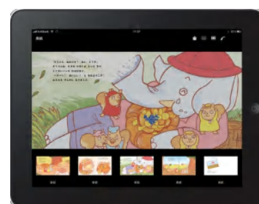
りすのパンやさん