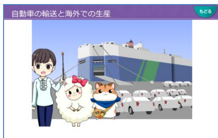
要点解説ムービー