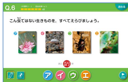
要点チェックドリル