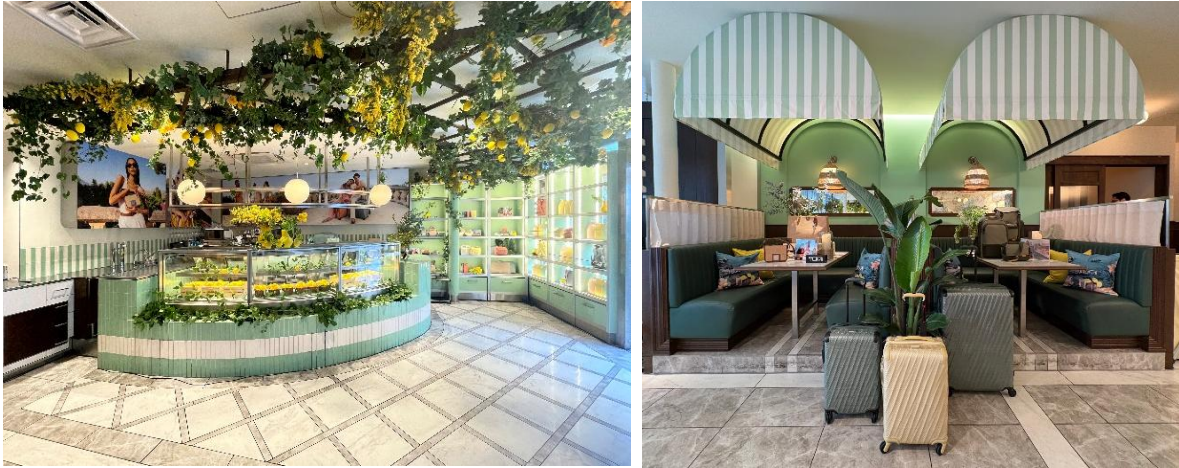
19 Degree Liteコレクション (タイム、ウォッシュド イエロー) Olas、Harrisonで構成されるラフィア調のカプセルコレクション

今季は新たに、ラフィア調のカプセルコレクションが登場。ラインアップを拡充した Olas〈オラス〉 と Harrison〈ハリソン〉 に、新たなテクスチャーと素材表現を加え、クラフト感のあるナチュラルな風合いとモダンな構造美を融合させました。さらに、バッグチャームからサングラスケース、レザーグッズまで、多彩なアクセサリがコレクションを豊かに彩ります。中でも、オリーブや花、レモンに着想を得たバッグチャームは、青空の下の市場やアマルフィ海岸のレモン畑、花々を思わせるデザイン。 Belden〈ベルデン〉 の サングラス・チャーム は、陽射しの下で過ごす長い一日に欠かせないアイテムです。