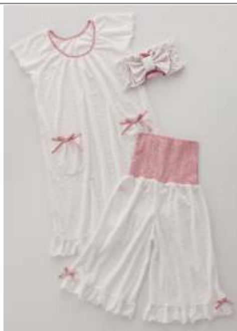
「スイートフラワー」がテーマの『söpö sopii』ルームウェアシリーズ

素材は肌触りよいパイルと、フィット感がよく、着心地抜群の綿ベア天竺。「スイートフラワー」というテーマの通り、パイル素材は花のモチーフが地模様となっており、また、綿ベア天竺もかわいらしい小花柄がプリントされています。この2つの素材のコンビネーションによるアイテムは、春めいた甘めのデザインで、ワンピースやパーカーなどトップス3種類、パンツやレギンス、ショーツなどボトムス4種類、ターバンをラインアップ。組み合わせることによって、様々な着こなしが楽しめます。