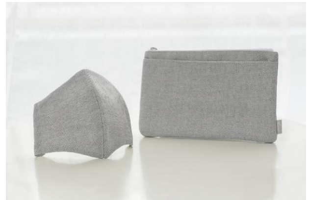
ヘリンボーンを使ったメンズマスク