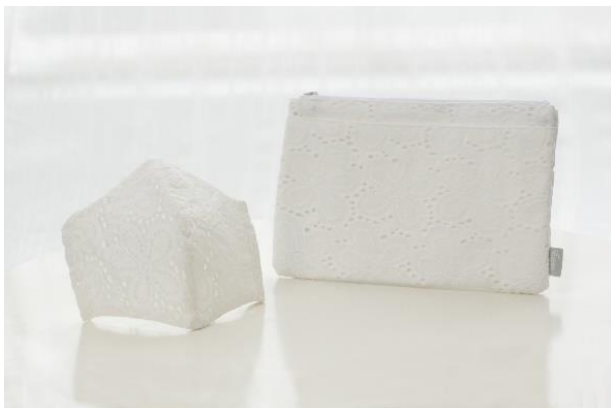
ウェディングドレスのような柔らかいレースを使ったレディースマスク

エスクリではこれまでとは違う環境の中で、会いたい人や守りたい人とのかけがえのない大切な時間を過ごすために一人ひとりが何をできるのか、何が必要か、新たな一歩を踏み出すために今、わたしたちにできることを考え、今では着用が日常となったマスクをオリジナルで製作しています。