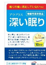
アラプラス 深い眠り