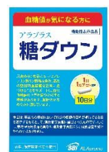
アラプラス 糖ダウン