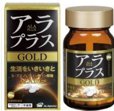
アラプラス ゴールド