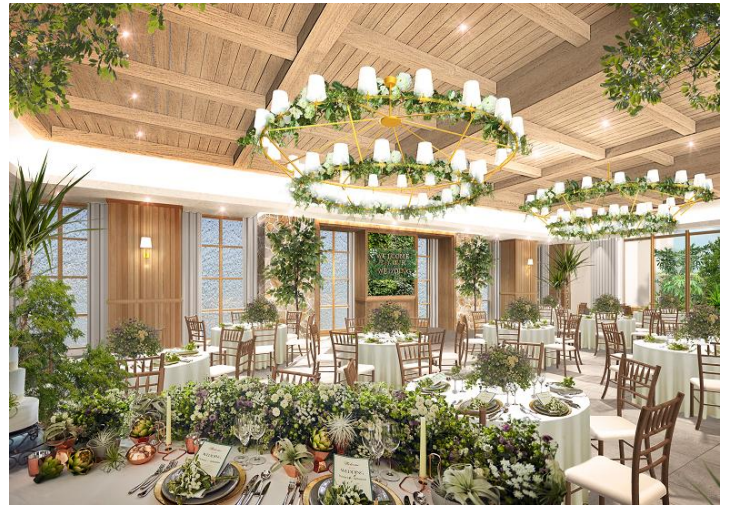
▲森のリゾートのような会場『ヴェルデカーサ』