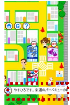
タウン内のアバターやショップに触れた場合のインフォメーション

自分の友人(フレンド)として登録しているユーザーがタウン内で位置情報を送信している場合には、フレンドアバターがタウン内に表示されます。 また、特殊なアバターはフレンド登録と関係なく表示される場合があり、重要な情報や、広告などに利用できます。