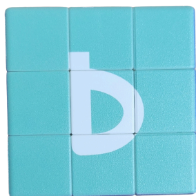
キャプ)ヌーラボオリジナル キューブパズル

各賞に該当するようなユニークなエピソードや事例をハッシュタグ「#Backlogサンキュー」を付けてXにてご応募ください。受賞された方には、特典として「プロジェクトテーマパーク」と「キューブパズル」をプレゼントいたします。さらに、惜しくも受賞を逃した方の中から抽選で9名様に「キューブパズル」をお贈りします。