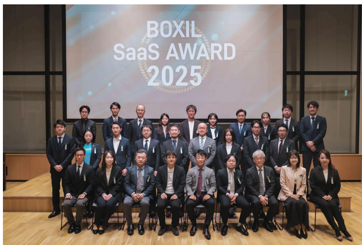
キャプション)「BOXIL SaaS AWARD 2025」授賞式の様子

さらに、「Backlog」とオンライン作図ツール「Cacoo」は、同日に発表された「BOXIL SaaS AWARD Spring 2025」の各部門で、「Good Service」を受賞しました。なお、「Backlog」は「同Autumn 2022」から11回連続、「Cacoo」は「同Spring 2024」から5回連続受賞となります。