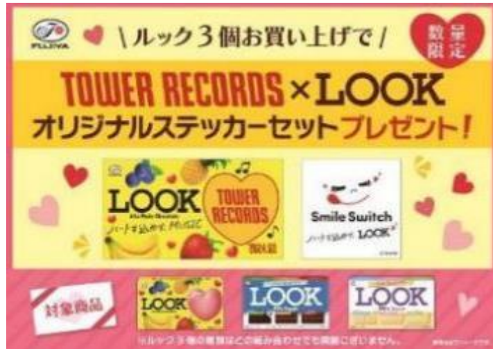
プレゼント企画バナー画像

タワーレコードは2月13日（火）から期間限定で、不二家『ルック』のバレンタインキャンペーンを開催。対象の10店舗にて、Snow Man 超特大・特大パネル展示と「TOWER RECORDS × 『ルック』オリジナルステッカー」のプレゼント企画を実施します。