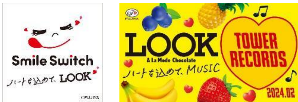
▲ 「TOWER RECORDS × 『ルック』 オリジナルステッカー」(2 枚 1 セット) イメージ

上記①対象店舗にて、ルックチョコレート 3 種類から合計 3 点お買い上げ毎に、限定デザインの「TOWER RECORDS × 『ルック』 オリジナルステッカー」(2 枚 1 セット) をプレゼントします。