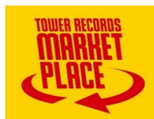
「タワーレコード マーケットプレイス」公式ロゴ（左）および公式アイコン（右）