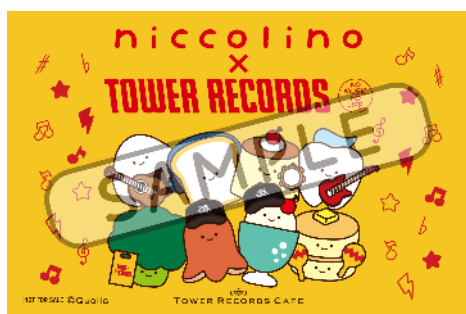
前期ステッカー（全1種）

コラボカフェをご予約のうえ、ご来店された方に予約席数分のステッカーを差し上げます。