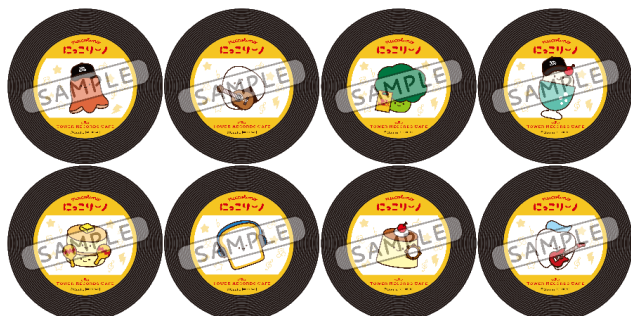
前期コースター（全8種）

コラボメニューのご注文1点ごとに、コースターをランダムで1枚お渡しします。また、3点セット<コラボフード1品+コラボスイーツ1品+コラボドリンク1品>をご注文の場合は、好きなデザインのコースターを1枚追加でお渡しします。