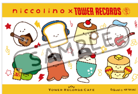
後期ステッカー（全1種）