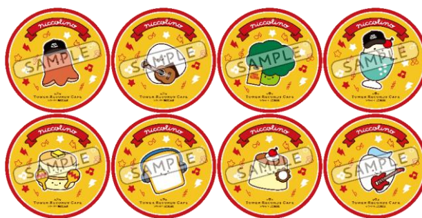
後期コースター（全8種）