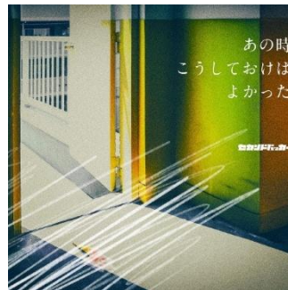
通常盤 PCCI-00035 2,200 円 (税込)