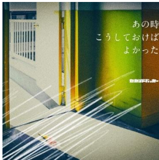
タワーレコード限定/初回限定盤 PCCI-00034 3,850 円 (税込)