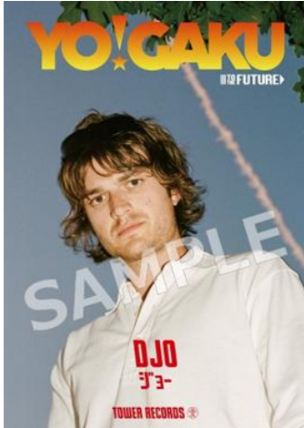
スマホサイズステッカー（全1種）

タワーレコード全店またはタワーレコード オンラインで『ディサイド』を購入の方にスマホサイズステッカーをプレゼントします。