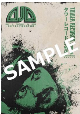
直筆サイン入りポスター絵柄