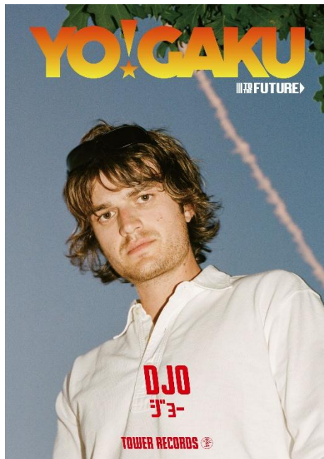
「YO!GAKU TO THE FUTURE」ジョー-ver. ポスター

タワーレコードは、いま聴いておきたい洋楽を盛り上げる企画「YO!GAKU TO THE FUTURE」キャンペーン第10弾を6月2日（火）より開催。今回はアンバサダーにジョーを迎え、全国のタワーレコードおよびタワーレコードミニ店頭でのポスター掲出をはじめ、タワーレコード オンラインを含む全店でキャンペーンを実施します。