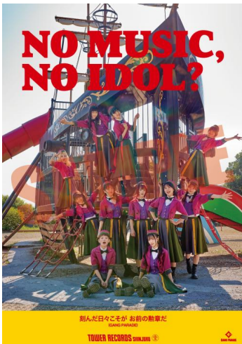
GANG PARADE 「NO MUSIC, NO IDOL?」 ポスター

対象商品：GANG PARADE 『GANG FINALE』 <厳選盤/完全盤/豪華盤>