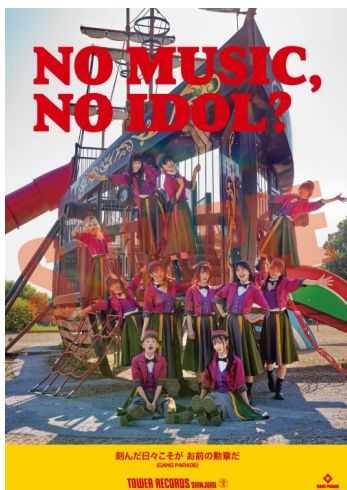
GANG PARADE「NO MUSIC, NO IDOL?」スマホサイズステッカー

対象商品：GANG PARADE『GANG FINALE』〈厳選盤/完全盤/豪華盤〉