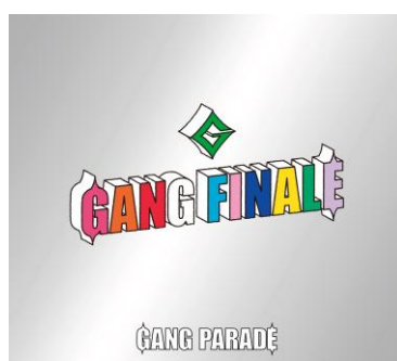
完全盤〈3CD〉 WPCL-13744 9,900円（税込）