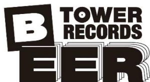
「TOWER RECORDS BEER」 ロゴマーク