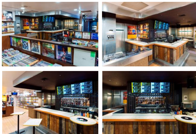
TOWER RECORDS BEER 渋谷店の内観