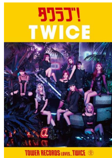
タワラブポスター 「HAPPY HAPPY」バージョン、「Breakthrough」バージョン

タワーレコード オンライン 特設ページ https://tower.jp/site/artist/twice