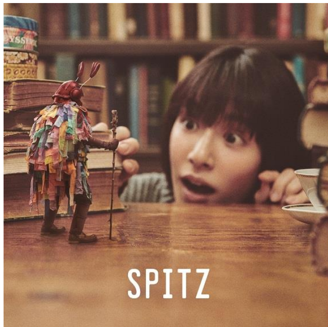
スピッツ『見つけ』初回限定盤・通常盤・LPジャケット