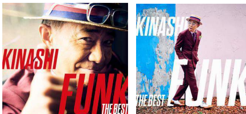
(左) 初回盤、(右) 通常盤