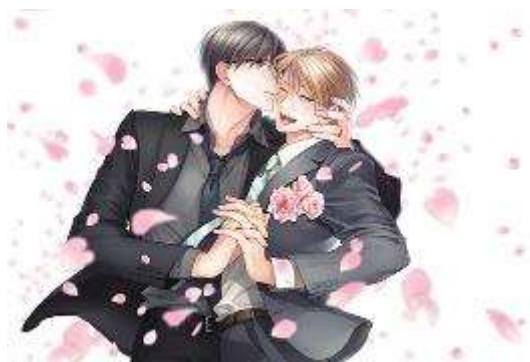
▲『秘密には向かない職業（上）』