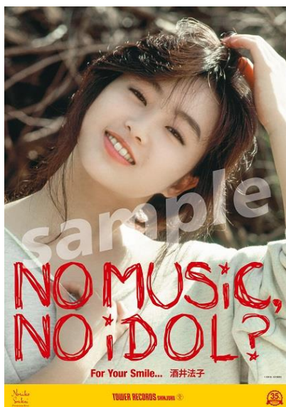
コラボポスターデザイン