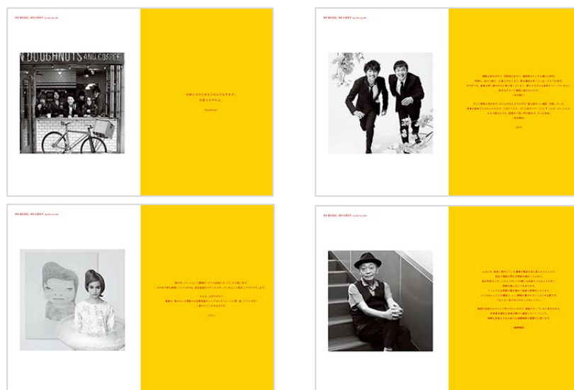
上 左から: 「NO MUSIC, NO LIFE.」 Suchmos、ゆず、のん、細野晴臣 (掲載イメージ)

さらに、『DOCUMENTARY PHOTO & MESSAGE OF "NO MUSIC, NO LIFE." Vol.2』の発売を記念して、広告集第2弾をご購入の方に、応募抽選で今回の広告集に掲載されているアーティストのポスターを50名様にプレゼントいたします。※詳細は次頁をご参照ください。