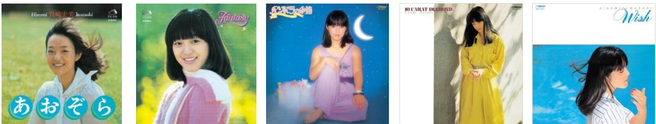
左より『あおぞら』『ファンタジー』『パンドラの小箱』『10 カラット・ダイヤモンド』『WISH』

タワーレコードでは今後も、当社の目利き力、全国の店舗網、オンラインをフル活用し、世界に残る名盤を復刻、さらには高音質での再発を手掛けていきます。